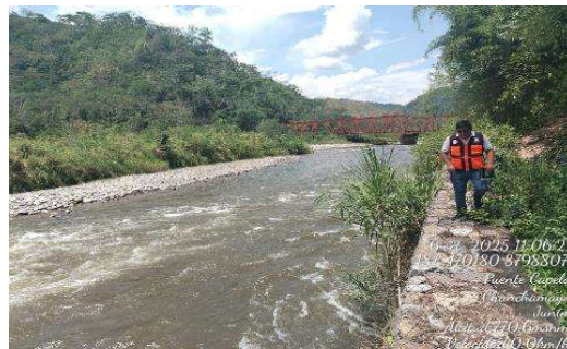
Fotografía 2: Sector Puente Capelo, Río Paucartambo.