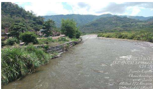
Fotografía N° 1: Sector Puente Capelo, se observa que el río Paucartambo se observa gaviones sinido afectados por el Río Paucartambo.